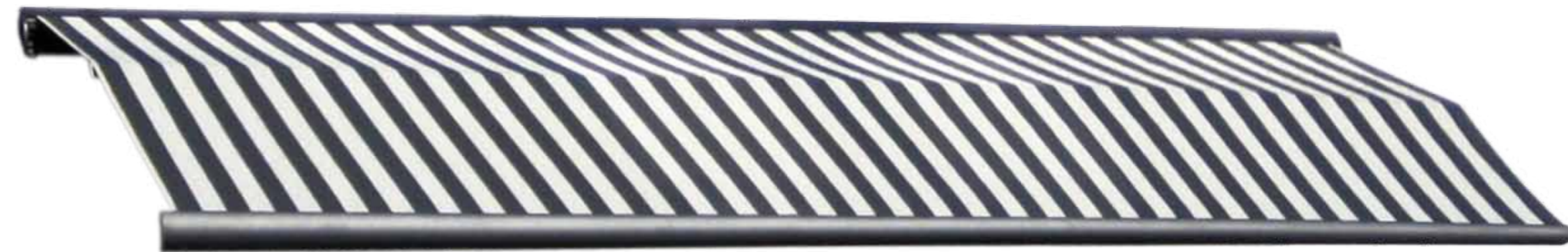
Designed by Giovanni Scaffidi